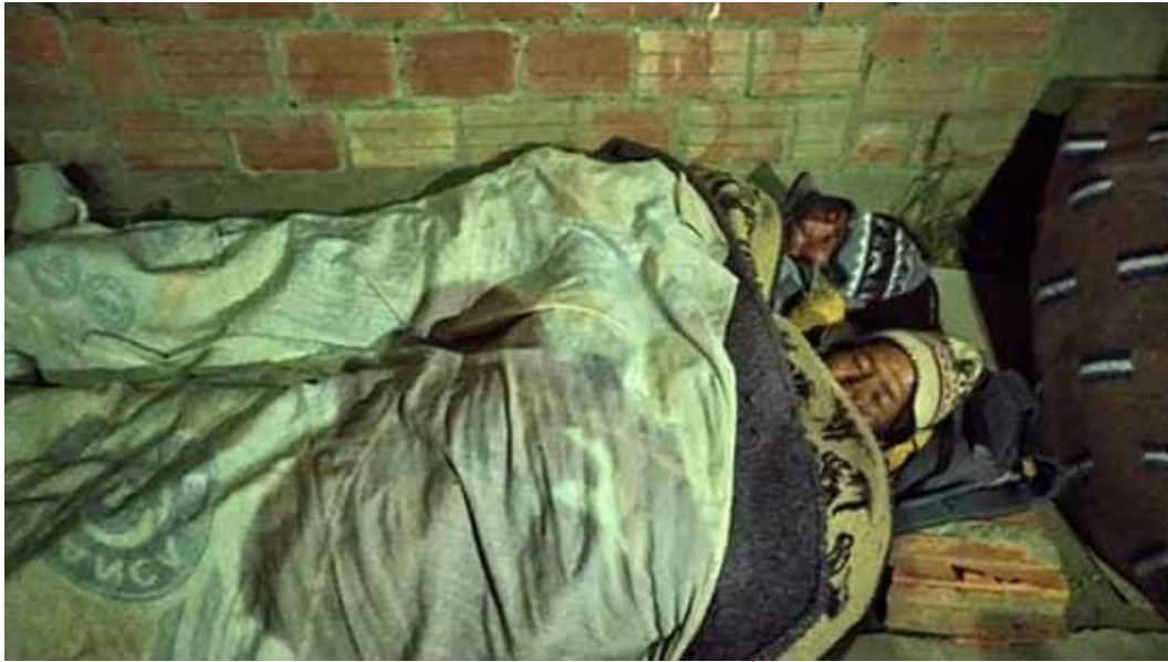
Personas de la tercera edad en las filas nocturnas para cobrar bonos.

escasos recursos. 36 En esta dimensión el análisis se concentra expresamente en las opciones y oportunidades que brindan los sectores de salud y de educación.