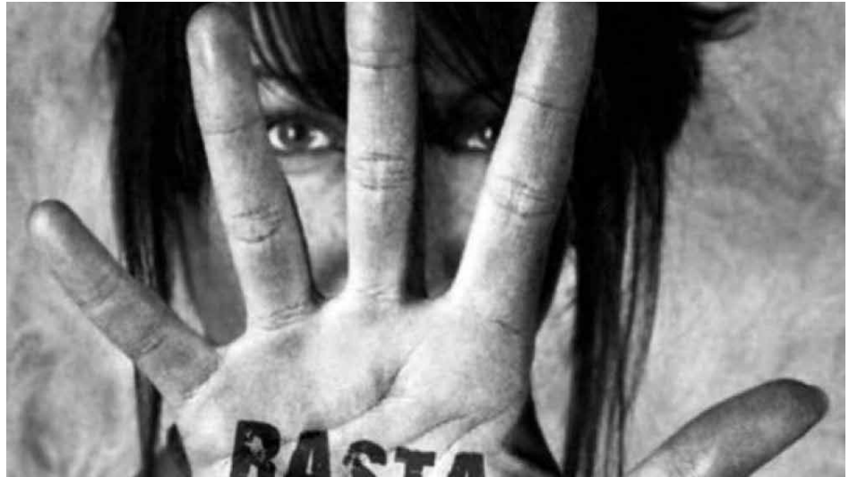
La violencia machista en la cuarentena cometió nueve feminicidios.

lidad de algunas poblaciones se han agudizado, y estos hechos han originado tensión en las interacciones, derivando en hechos de violencia que afectan principalmente a mujeres y niñas. La Dirección Nacional de la Fuerza Especial de Lucha Contra la Violencia (FELCV) reportó que, en 38 días de