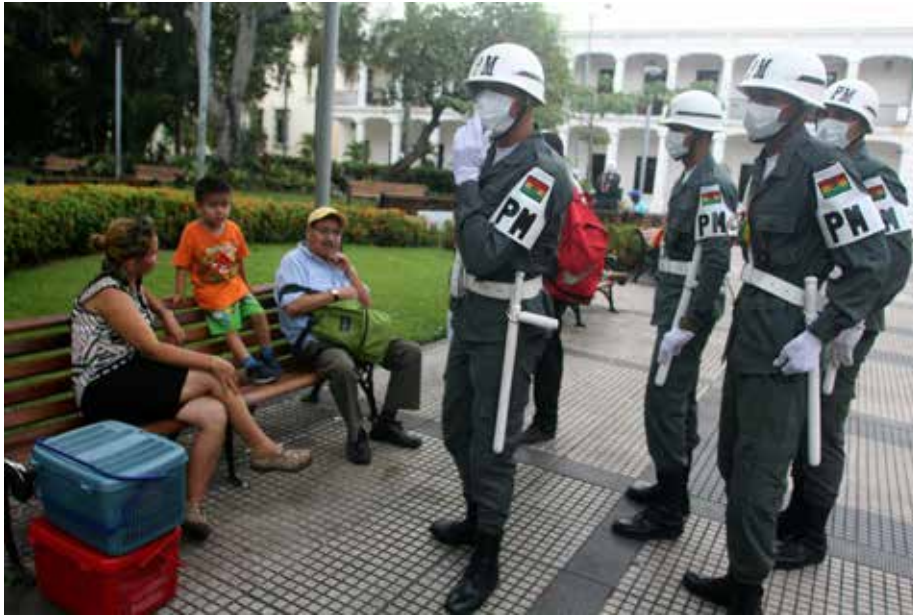
Control de policía militar (PM) en las urbes.