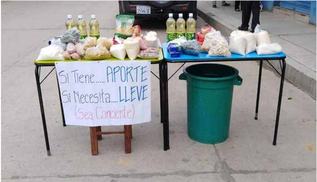
Iniciativas ciudadanas de solidaridad.

Interconexión y codependencia son dos conceptos abstractos que, con la pandemia del COVID-19, se hicieron realidad a nivel global. “Cualquier cosa que ocurra en un lugar del mundo tiene efectos en el resto del planeta”, había señalado Zygmunt Bauman. Al presente, el coronavirus nos obliga a realizar cambios en nuestras vidas individuales y colectivas, porque después de abril la normalidad será otra: una que aún se configura, que tiene rasgos de imprevisibilidad y en la cual prima la incertidumbre.