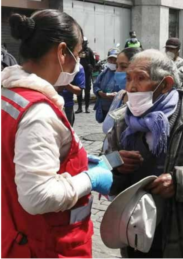
Brigadas médicas trabajando en ciudades

$us 1.425.012. 6 Por otro lado, el Ejecutivo solicitó al Banco Mundial el cambio de clasificación de país, lo que permitiría acceder a líneas de crédito en condiciones más favorables. 7