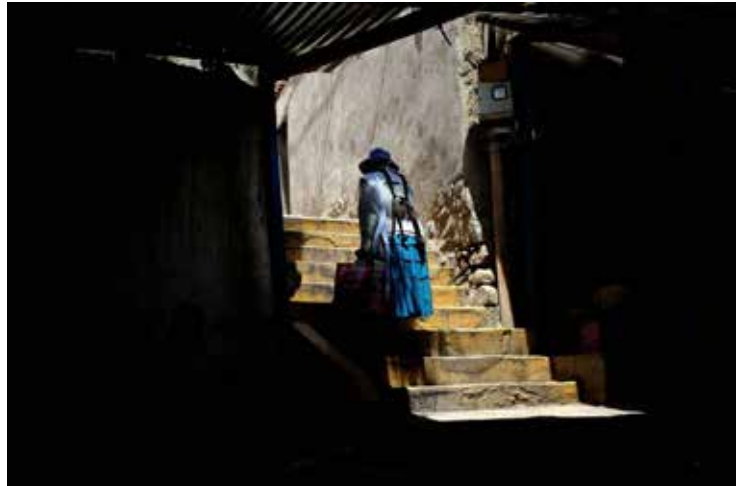
COVID-19 genera incertidumbre donde crecen las brechas socioeconómicas.

limitada cobertura de entidades financieras, entre otros), el Estado tiene como una tarea pendiente el modernizar su infraestructura de gestión financiera y de conocimiento sobre los sectores o lugares con menores oportunidades.