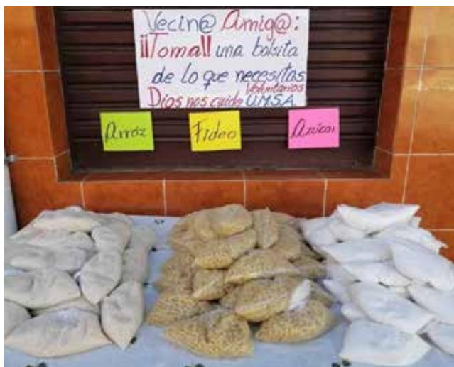
Iniciativas ciudadanas de solidaridad.