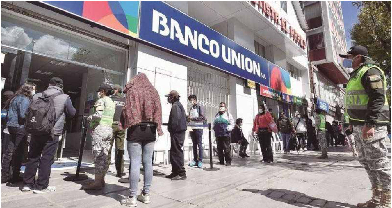
Filas en los bancos para cobrar los bonos.

organizaciones civiles han sistematizado información referida a la crisis sanitaria 4 . En esa línea, la Fundación UNIR Bolivia busca analizar de manera sucinta las subdimensiones priorizadas y respaldar este análisis con información relevante, que aporte al diseño de medidas que contemplen la sensibilidad al contexto/conflicto, evidenciando riesgos, problemas y tensiones, pero también oportunidades que deben ser tratadas desde un enfoque diferencial y la vigencia plena de los derechos humanos.