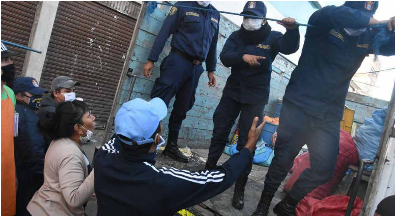
Vendedores ambulantes reclaman a gendarmes municipales.

embargo, en dicho sistema no se encuentran registradas las compras de salud para la crisis; solo figuran 43 contratos por spots. 17